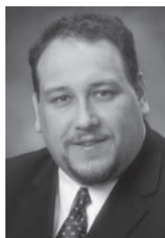
Jean-François Roux Député d'Arthabaska

Porte-parole de l'opposition officielle en matière de régions